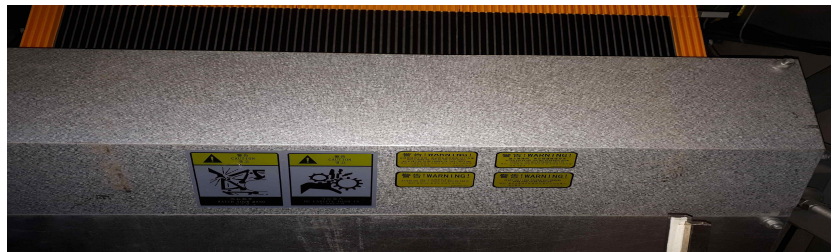
[사진 4] 스텝 보호판