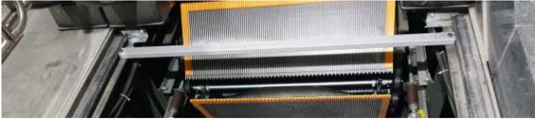
[사진 6] 랜딩플레이트 추락 방지 지지대

4.3.4.5 상,하부에 조명시설(Under Step Light)은 시종점부 측면에 자동센서와 함께 ON/OFF 되는 조명 시설(Comb Light)을 설치하며, 콤 플레이트 주변조명이 충분할 경우 발주처와 협의 후 제외할 수 있다.