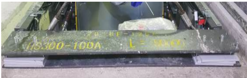
[사진 3] 트러스 보강판