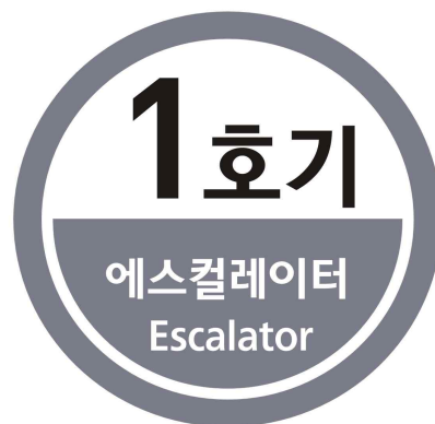
[그림 3] 에스컬레이터 호기 스티커 양식(90x90mm)